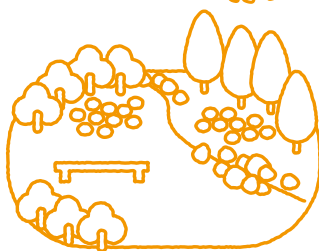
オレンジパーク ふなはし

子育てコミュニティ賃貸住宅は、舟橋村が目指す子育て共助のまちづくりプロジェクトのモデルエリア「舟橋型子育てシェアビレッジ」の中にあります。多世代が集う公園と認定こども園に隣接し、村民が主役となって様々な交流イベント等を通じて、子育てを頼りあえる暮らしを推進していきます。コミュニティがうまれる仕掛けがいっぱい詰まった住宅での暮らしを、ぜひご体感ください!