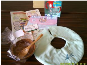
▲バースデイボックス(見本) スタイまたはカトラリーのどちらかになります

舟橋村では、出生時に舟橋村に住所を有するお子様を対象に、生まれてきたことを お祝いする「バースデイボックス」をプレゼントしています。2か月児訪問でお渡しし ています。