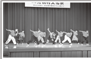
元気一杯のダンス