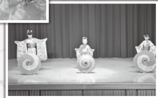
傘を使った優雅な動き