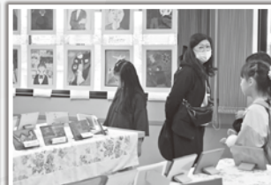
小中学生による 心のこもった作品展示