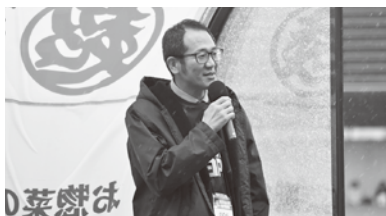
村長からカターレメンバーへ 激励の言葉を送りました