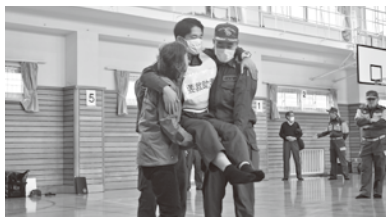
正しい方法で女性でも楽に搬送出来ます