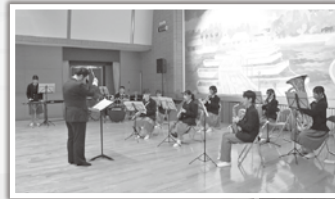
舟中吹奏楽部による 素敵なオープニング