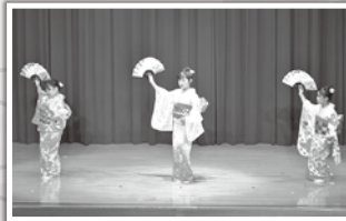
手先までしなやかです