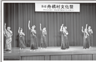
ハワイを感じ、温かい雰囲気になりました