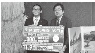
舟橋村の日のパネルをいただきました

舟橋村の日はサガン鳥栖との試合で、結果は3-1で勝利。あいにくの大雨でしたが、舟橋村からも多くのサポーターが応援に駆けつけ、寒さも吹き飛ばす熱い試合となりました。