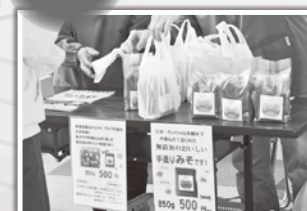
真心込めて作ったお味噌の販売