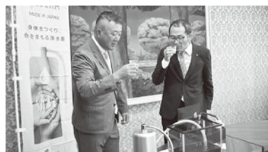
浄水した水を試飲しました