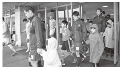
舟橋村の子供たちによる 選手のエスコート