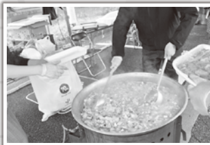
大きな鍋で作る豚汁は最高です