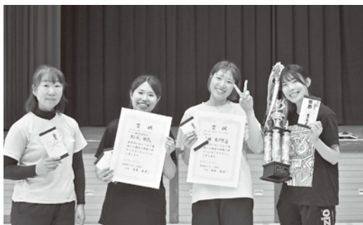
女子の部優勝 東芦原B