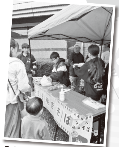
こども公園部長による 焼きそばの販売

フードエリアでは、ハンバーガーや唐揚げ、クレープ、駄菓子、焼き鳥、紅茶やパンにおむすびなど様々なお店が出店されました。今年はこども公園部長の焼きそばとジュースの販売も行われました。子供たちがみんな協力しながら、販売や接客をがんばっていました！