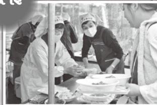
文化祭では欠かせない赤十字奉仕団のカレー