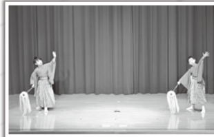
力強い舞を披露してくれました