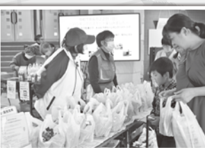
舟橋村にお花の輪を広げよう