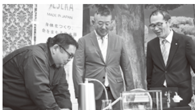
実演していただきました