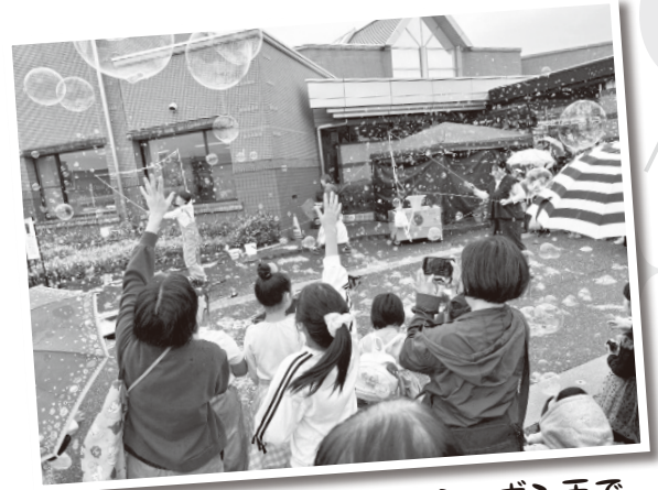
シャボン玉で あそぼう！