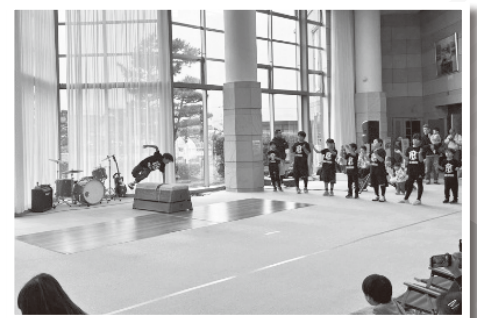
アクロバット パフォーマンス！