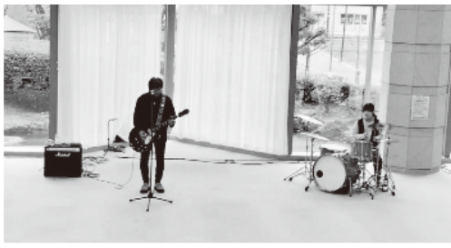
館野親子 による演奏♪