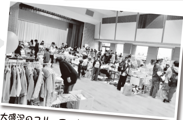
大盛況のフリーマーケット