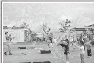
おおきなしゃぼん玉に大興奮