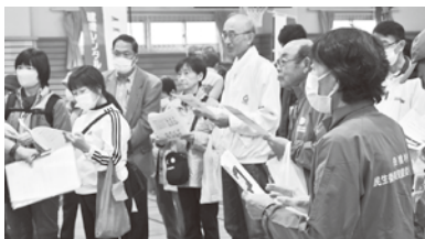
災害ボランティア訓練にはたくさんの方が志願しました

また舟橋村社会福祉協議会による災害ボランティア訓練も行われました。災害ボランティアとは被災者が少しでも早く日常生活に戻れるように、見返りを求めずに手助けをすることです。参加者は避難場所での心のケアについても学んでいました。その後舟橋分遣所により要救助者の搬送方法について講座が開かれました。要救助者の健康状態や周囲の状況に応じて、様々な搬送方法があります。舟橋分遣所の方にご指導いただきながら、参加者も実際に人を搬送するだけでなく、搬送される側も体験しました。