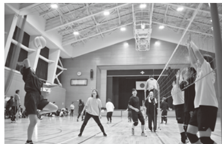
ネット際の激しい攻防

今年も地区対抗の舟橋村ビーチボール大会が開催され、幅広い年代の参加者と応援の方々が会場に集まりました。競技が始まると、各コートでは白熱した試合が続き、力強いスパイクや巧みなレシーブが決まるたびに大きな歓声があがりました。仲間同士で声を掛け合いながらプレーする姿や、地域の絆を感じる応援の声があふれ、会場は終始熱気に包まれていました。迎えた決勝戦では、大会開始直後は敵として戦ったチームからも温かなエールが送られ、会場全体が一体となって盛り上がりしました。