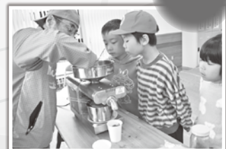
ひまわりのいい香りがします