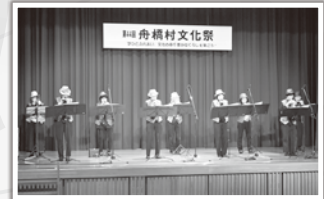
美しいオカリナの音色