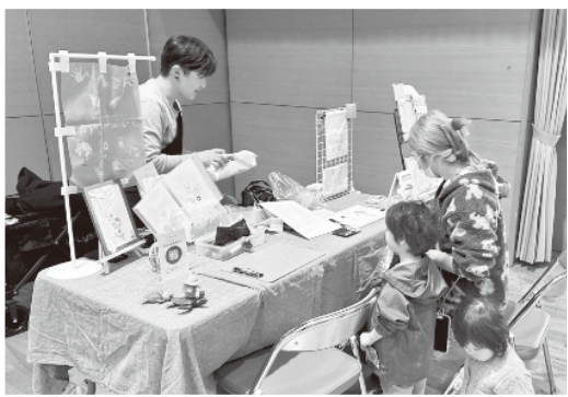
親子でハンドメイド！