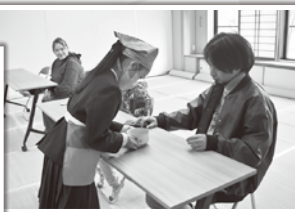
季節を感じられる和菓子と おいしいお茶