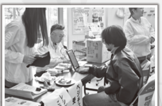
明治安田生命によるベジチェック