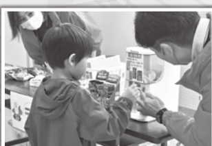
社会福祉協議会ブースは大人も子供も 楽しめます