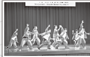
大きな動きで会場を盛り上げます