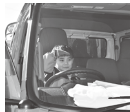
見晴らしはいかが？