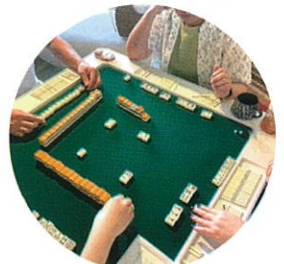
5/14(木)PM 女性健康マーじゃん