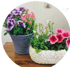
5/10(日)PM 母の日寄せ植え作り