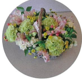
5/30(土)AM フラワーアレンジメント