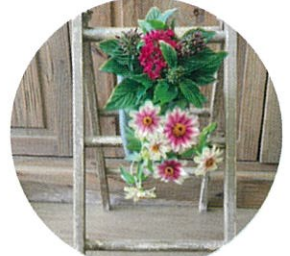
5/24(日)PM エコフラポット教室