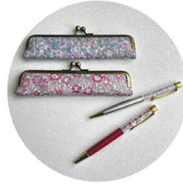
5/13(水)PM カルトナージュ