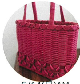
6/14(日)AM 6/28(日)AM クラフトバック作り