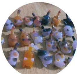
5/9(土)PM レジンねご教室