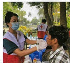
2025年ミャンマー地震