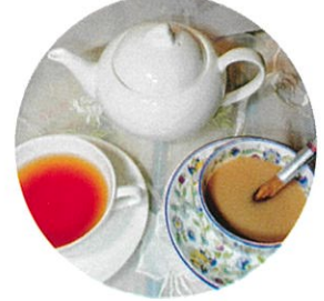
6/21(日)PM 紅茶教室ミルクティー

※講師の都合で変更になったり、講座が追加になっている場合があります。 ホームページにてご確認ください