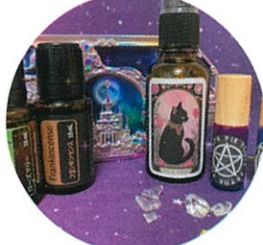
5/22(金)PM 魔法のアロマ作り