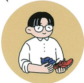
5/8(金)PM 靴の履き方・選び方