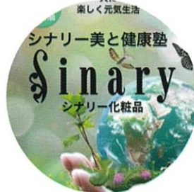
5/31(日)PM シナリー美と健康塾