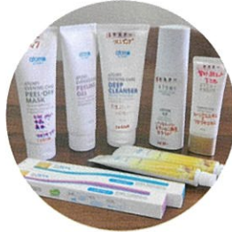
5/16(土)AM 韓国コスメ体験会