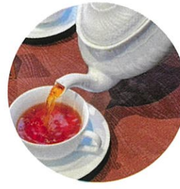
5/16(土)PM 紅茶教室 HowTo