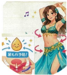
5/21(木)AM ベリーダンスで尿漏れ防止